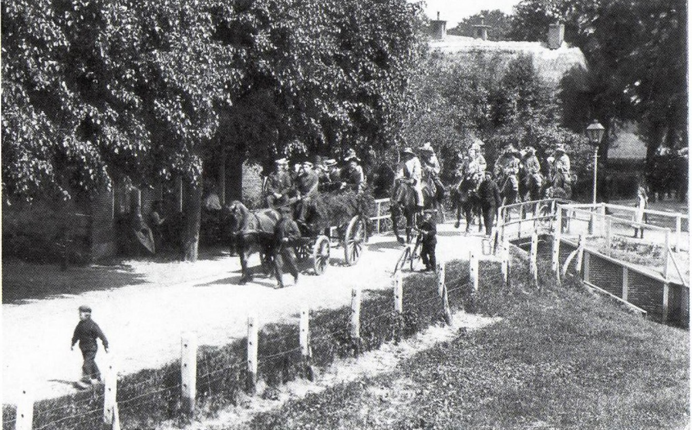
Bakkerij bij de brug